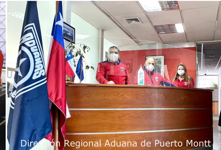
Dirección Regional Aduana de Puerto Montt