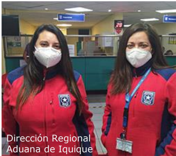
Dirección Regional Aduana de Iquique

Mamparas autosoportantes acrílicas divisorias