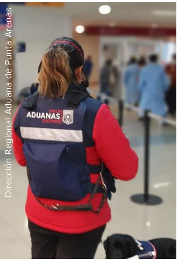
Dirección Regional Aduana de Punta Arenas