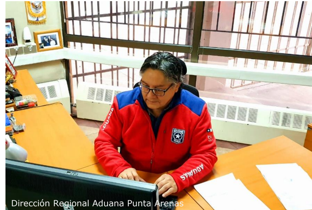
Dirección Regional Aduana Punta Arenas

Autoriza la celebración de audiencias referidas al numeral 2.3.1.7 del capítulo III del Manual de Pagos por videoconferencia.