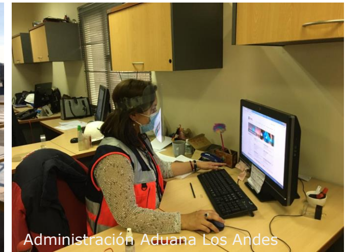
Administración Aduana Los Andes