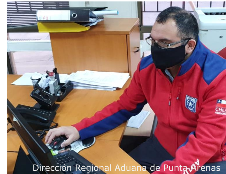
Dirección Regional Aduana de Punta Arenas

Notificación de las respuestas a solicitudes enviadas por correo electrónico a los Agentes de Aduana, a la casilla que el respectivo despachador tenga registrada en el Servicio.