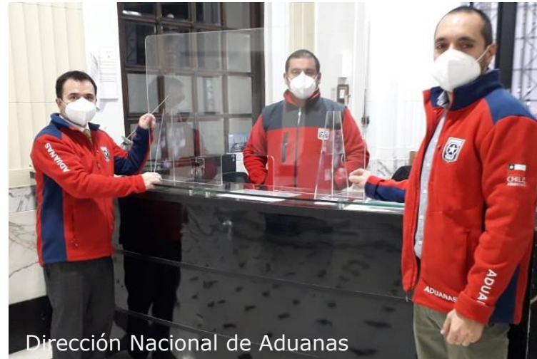
Dirección Nacional de Aduanas