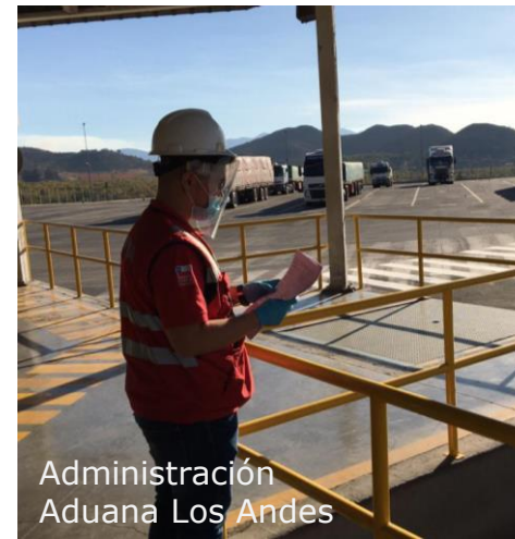
Administración Aduana Los Andes