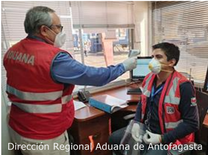
Dirección Regional Aduana de Antofagasta