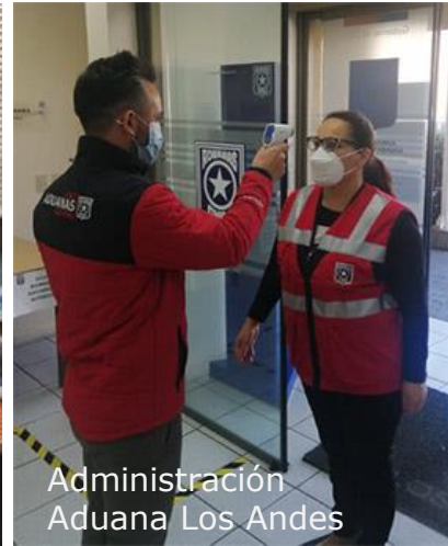
Administración Aduana Los Andes