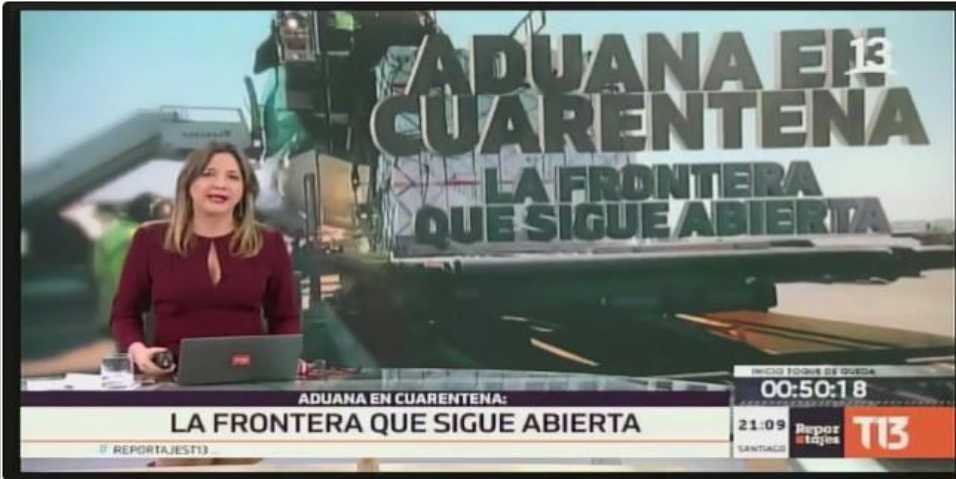
En tres semanas han ingresado por un monto de 8,1 millones de dólares, un alza del 3.384%

Aduanas e ISP aplicaron medidas para agilizar la llegada de insumos médicos.