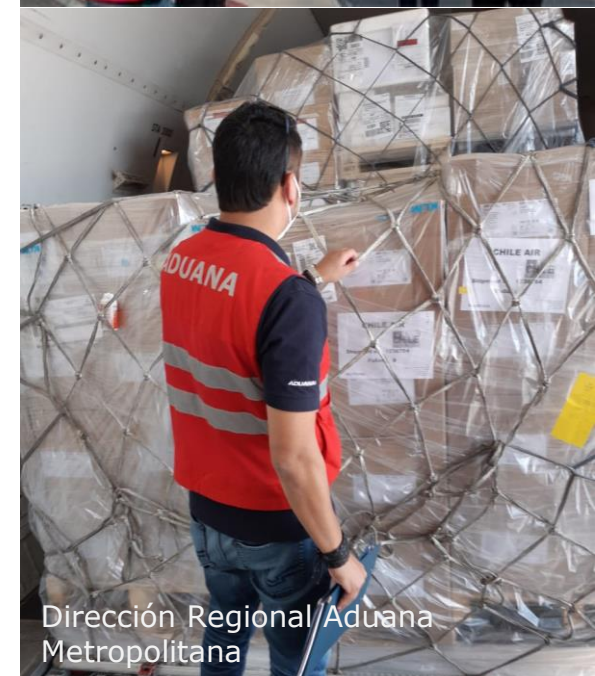
Dirección Regional/Aduana Metropolitana