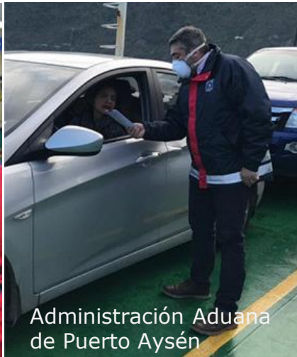
Administración Aduana de Puerto Aysén