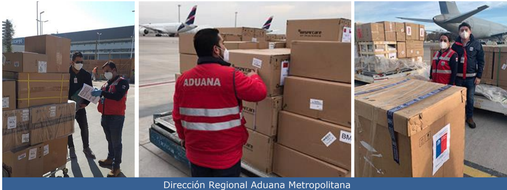
Dirección Regional Aduana Metropolitana

Resolución Exenta N°1.313, del 26 de marzo, que permite la tramitación preferente de insumos críticos