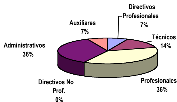
Gráfico 2: Dotación Efectiva año 2005 por Estamento