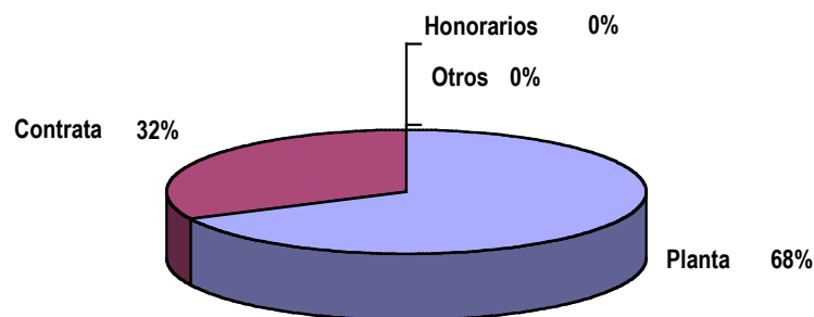
Gráfico 1: Dotación Efectiva año 2005 por tipo de Contrato